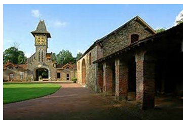
Montilliers—Château de Tirpoil