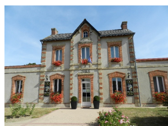
Mairie déléguée de Tancoigné (Lys Haut Layon)