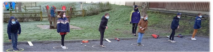
Initiation à la pétanque

Pour les prochaines vacances d'avril : Tailleur de pierre, Affuteur rémouleur et création d'un observatoire à insectes.